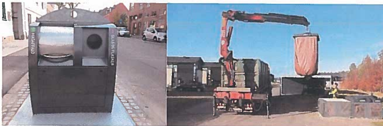
Eksempel på nedgravet affaldsløsning

På afdelingsmødet i 2017 blev det besluttet at afsætte penge til etablering af en ny nedgravet affaldsløsning i afdeling 607.