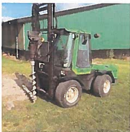
Sådan ser borevognen omtrent ud

Vi begynder med de indledende undersøgelser af jordbunden i slutningen af maj/start juni. Der vil i den forbindelse blive lavet nogle boreringer så vi kan finde ud af, om der ligger noget i jorden som ikke fremgår af diverse tegninger, og som vi helst ikke skal grave ned i. Vi forventer at disse undersøgelser vil tage en uges tid.